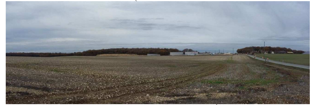
Photo 1 - PC8 - Paysage lointain