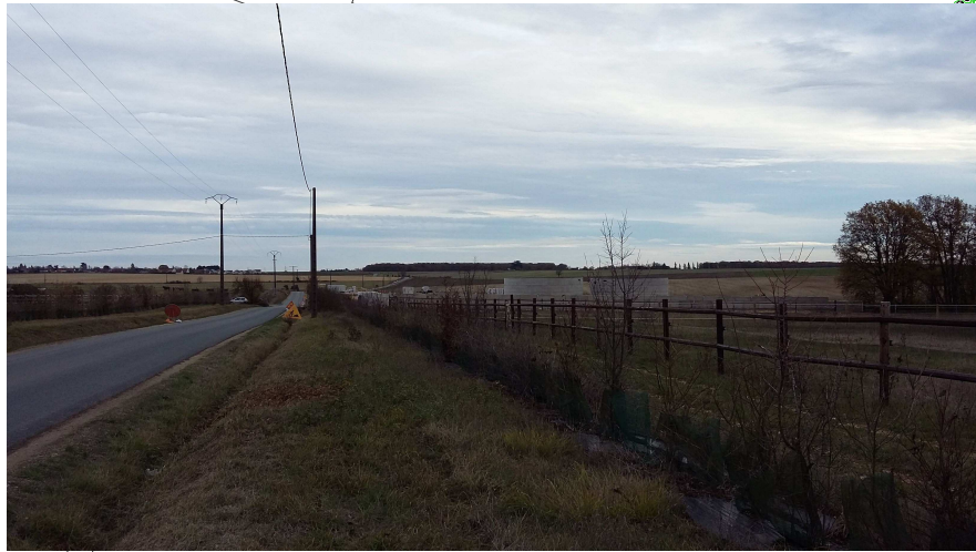
Photo 2 - PC7 - Environnement proche